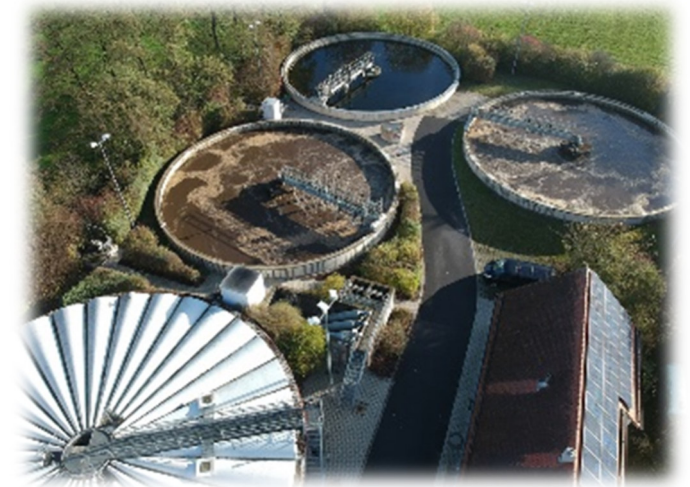
Unsere Kläranlage in Hirschau von oben

HIRSCHAU, MASSENRIECHT, KINDLAS, EHENFELD werden von uns betreut.